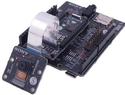
「電子楽器のオーケストラ」に用いられる SPRESENSE