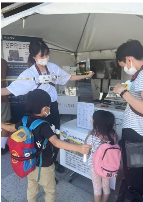
「Road to 2025!! TEAM EXPO FES」の様子

MB 専攻生 4 人で構成された「音 JOY」は、誰でもすぐに演奏できる「ゆる楽器」の研究に取り組んでいます。活動のきっかけとなったゆる楽器との出会いのエピソードや、大阪・関西万博“ほぼ”1000 日前イベント「Road to 2025!! TEAM EXPO FES」での体験談、ゆる楽器のアイデアを具現化するコンテスト「ゆる楽器ハッカソン」から受けた刺激、そして「Sensing Solution アイデアソン・ハッカソン 2022」への挑戦など、音 JOY のこれまでの活動について発表しました。