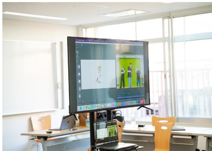
お手軽バーチャル体験

来場者参加型ブースでは、Adobeのソフト「Character Animator」を活用したバーチャル体験を提供しました。来場者がグリーンバックを背にモニターの前で動くと、あらかじめ設定されたキャラクターがその動きを再現する仕組みで、このブースには子供も訪れるなど、大きな賑わいを見せました。