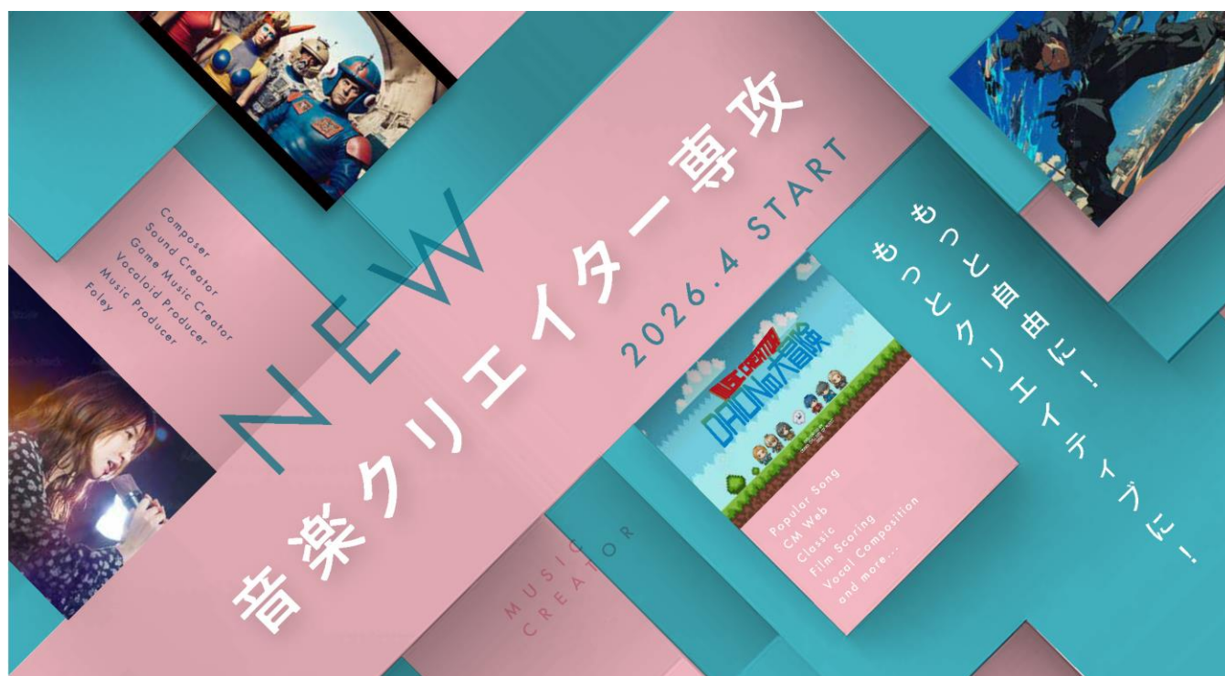
2026年4月新設「音楽クリエイター専攻」

2026年4月より大阪音楽大学（所在地：大阪府豊中市、学長：森本友紀）は、あらゆるジャンルの作曲を学べる「音楽クリエイター専攻」（大学4年制）を新たに開設します。