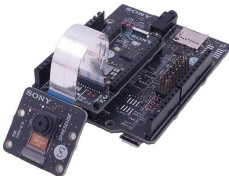
「電子楽器のオーケストラ」に用いられる SPRESENSE

大阪音楽大学ミュージックビジネス専攻（以下、MB専攻）は、半導体事業を展開する ソニーセミコンダクタソリューションズ株式会社（以下、SSS）と共同で、コンパクトな省電力ボードコンピュータ「SPRESENSE™」を用いた教育的取り組みを実施し、教育パッケージの開発・研究を開始いたします。