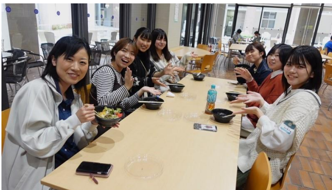
(写真左) 昼食時間も惜しまず作戦会議。「見せ方」についてひたすら議論した