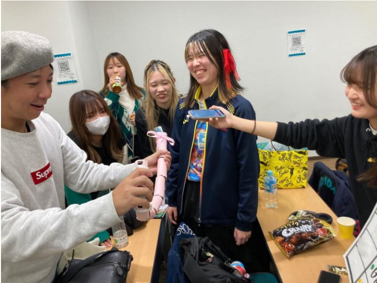
(写真右) SPSESENSE を使用し息を吹き込む量で曲の速さを変えることができる楽器。外装は、大阪・関西万博のキャラクターをイメージしたという