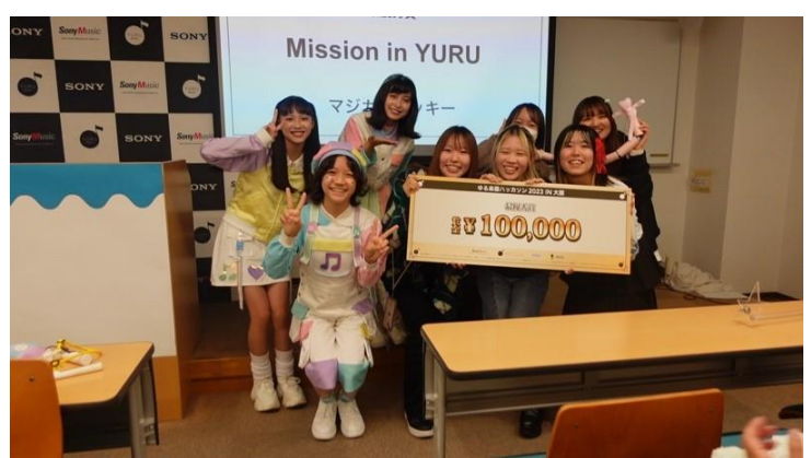
(写真右) 最優秀賞を受賞した、チーム Mission in YURU「マジカルバッキー」

今後も、音大生が持つ音楽を軸としたユニークなアイデアとテクノロジーを掛け合わせ、新たな音楽環境の構築に貢献していきます。