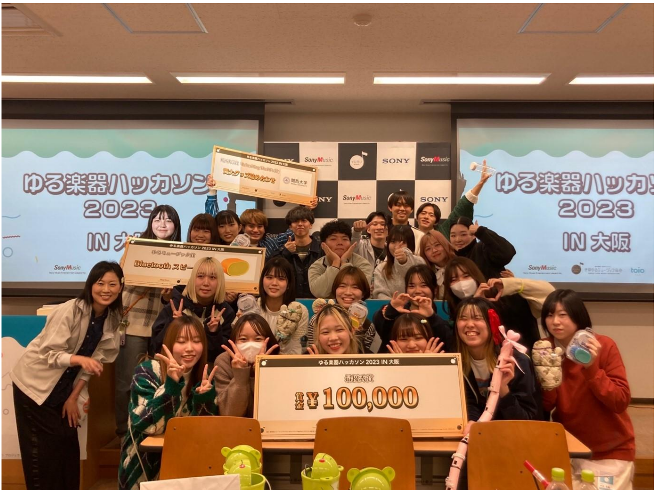
ゆる楽器ハッカソンに参加した大阪音楽大学ミュージックビジネス専攻生

最優秀賞を含む3冠受賞！ ミュージックビジネス専攻、 「ゆる楽器ハッカソン」で成果