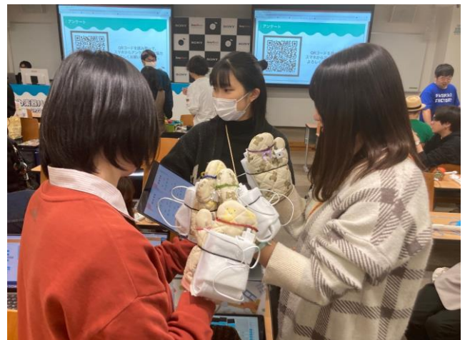
(写真右) KOOV を使用し「手遊び」をテーマにミトンを合わせることで演奏できる楽器。「見せ方」に最後までこだわった