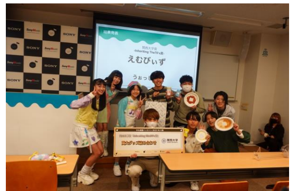
(写真右) 関西大学賞を受賞した、チームえむびいず「うおっしいず」