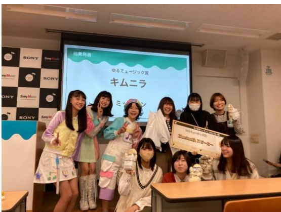
(写真左) ゆるミュージック賞を受賞した、チーム キムニラ「ミットーン」