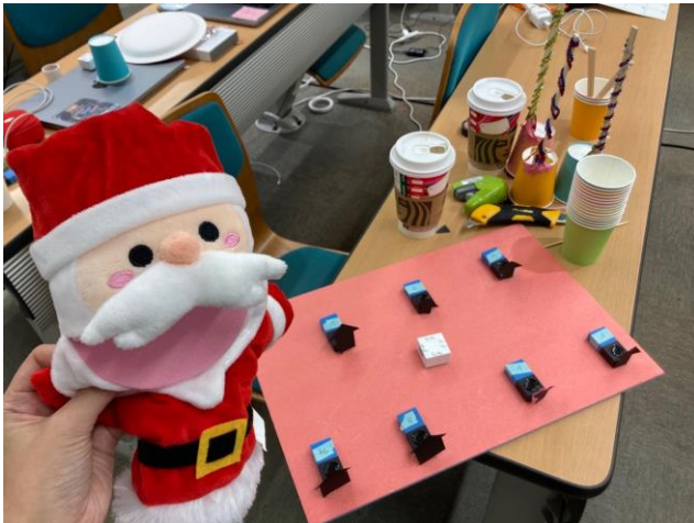
(写真左) MESH を使用してサンタさんが街を巡り音を奏するというストーリーを楽器にした作品。ハンドベルに見立てた紙コップを、家に見立てたセンサーにかぶせると音が鳴る